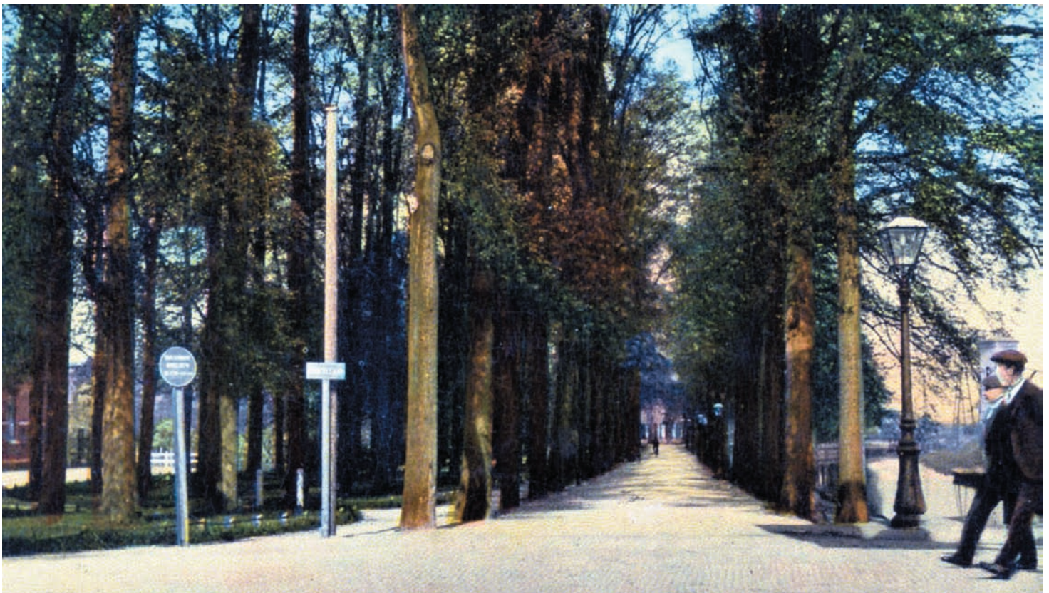
Ansichtkaart van de Croeselaan

Het zijn veelal 'kleine bouwertjes' die aan het einde van de 19e en het begin van de 20ste eeuw bouwen in en aan Utrecht. Ze realiseren kleine projecten. Meestal niet meer dan een handvol woningen. De 'aangevraagde', de aannemer M. v. d. Brand uit de Amaliastraat is zo'n 'klein bouwertje'. Een eigenbouwer die niet voor een bekende opdrachtgever bouwt maar voor