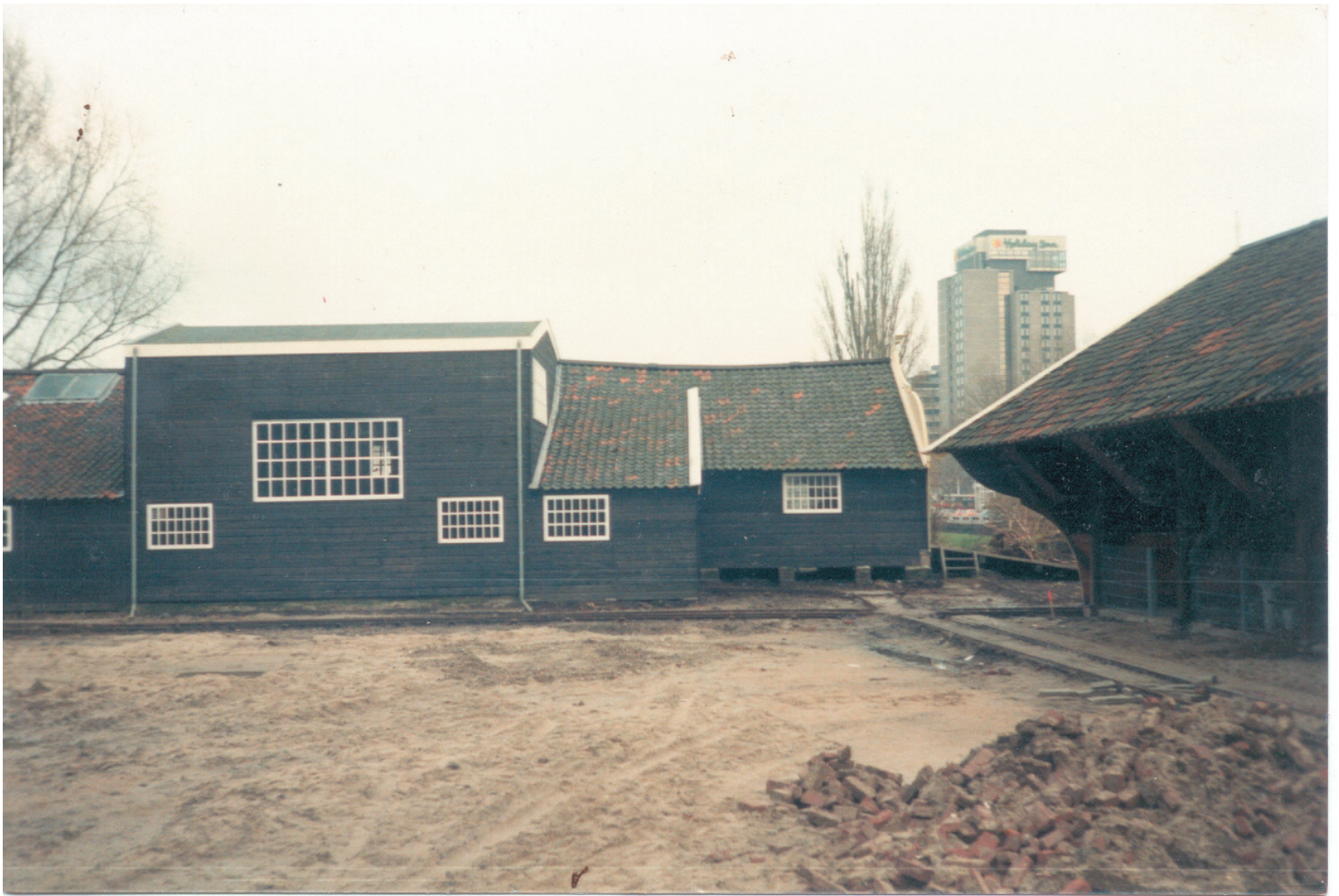
Het terrein van de molen lag braak

geweest in zijn huisje, is hij vertrokken en stond alles weer leeg.