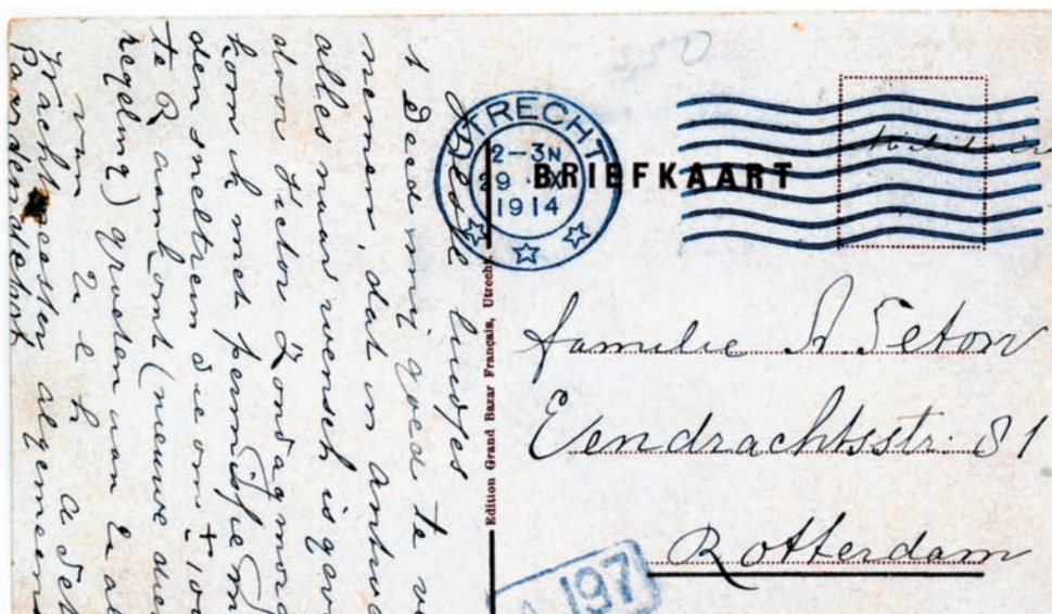
De kaart is verstuurd in 1914